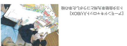
【アモンキヤロトルリBOX】 トヨタ自動車九州とコラボした車の絵