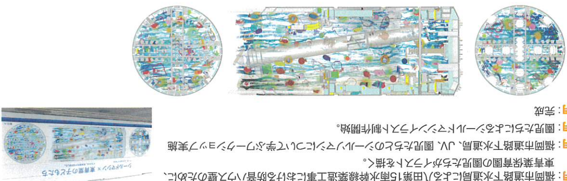
シールイラスト × 東園の子たち

2016年5月～2017年3月 : 福岡市道路下水道局による八田第15雨水幹線築造工事における防音ハコ壁のために、東青葉保育園の園児たちがイラストを描く。 2016年7月 : 福岡市道路下水道局、JV、園児たちとのシールイラストについて学ぶワークショップ実施 2016年8月 : 園児たちによるシールイラスト制作開始。 2017年4月 : 完成