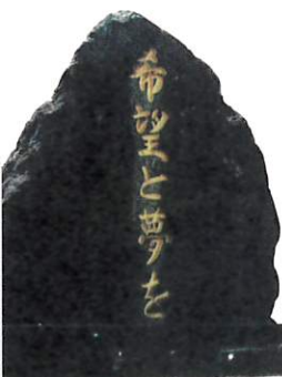
思いを込めた石碑