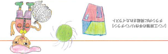
リビエ里雅の手作りパズルイラスト内に掲載されたイラスト