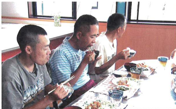
協調性を育む環境

脇田温泉の穏やかで静かな環境が自慢です。 利用者が日常生活・社会生活としても自立して過ごすことができるよう、 元気いっぱいのスタッフが精一杯支援いたします。 鮮やかな空の壁紙が印象的なリビングルームなど、設備も整えてお待ちしております。