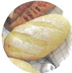
チーズベーコンパン：160円