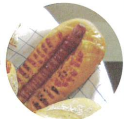
ソーセージパン：150円