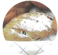
くるみレーズンパン：150円