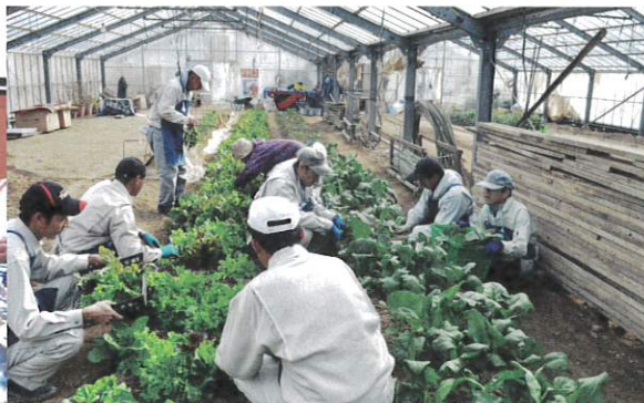
みんなで楽しく作業