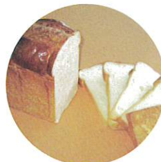
ホテル食パン：1斤 230円